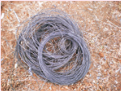
コーティングワイヤー