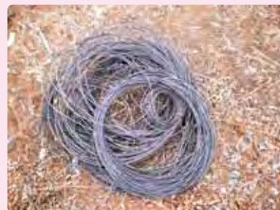
コーティングワイヤー