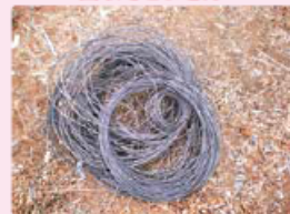
コーティングワイヤー